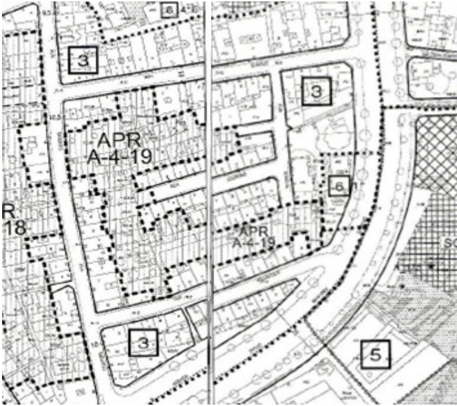
Planos nº 9-N y 9-O de la serie 2 del PXOM 2008

Dichas Ordenanzas 3 y 6 del PXOM 2008 se corresponde con las del mismo nombre que se incorporaron en el Instrumento de ordenación provisional (IOP) aprobado definitivamente por el Pleno del Ayuntamiento de Vigo el 24 de julio de 2019 (expediente 16022/411).