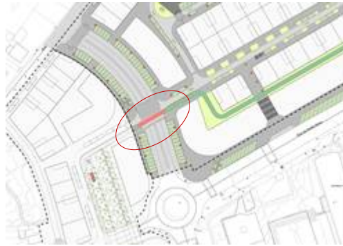
Figura 4. Perda de trazado do carril bici no encontro coa Rúa das Ufas / Padre Seixas

Este mesmo criterio sería aplicable no caso de as fases A e B no se executasen de xeito simultáneo: sempre que sexa posible, deben preverse tramos provisionais que den continuidade os peóns ou ciclistas e os permitan dirixirse cara a tramos xa urbanizados.