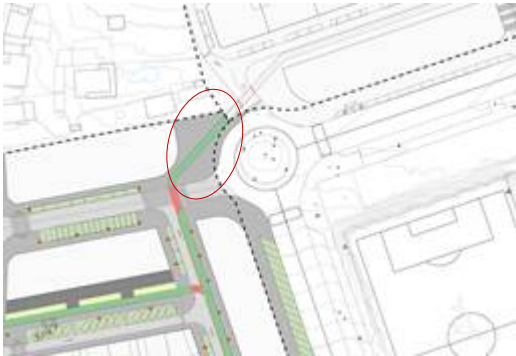
Figura 3. Perda de trazado do carril bici no encontro coa Rúa das Lamelas