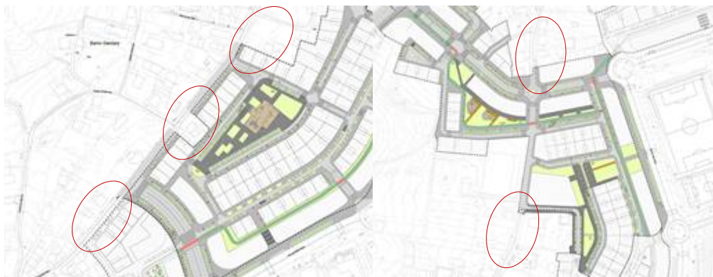
Figura 2. Identificación de zonas con perdas de continuidade na sección de urbanización da Rúa San Paio.

prevista non ten continuidade cos tramos da rúa que se atopan fora da ordenación do Plan Parcial. A situación referida reflíctese nas seguintes imaxes: