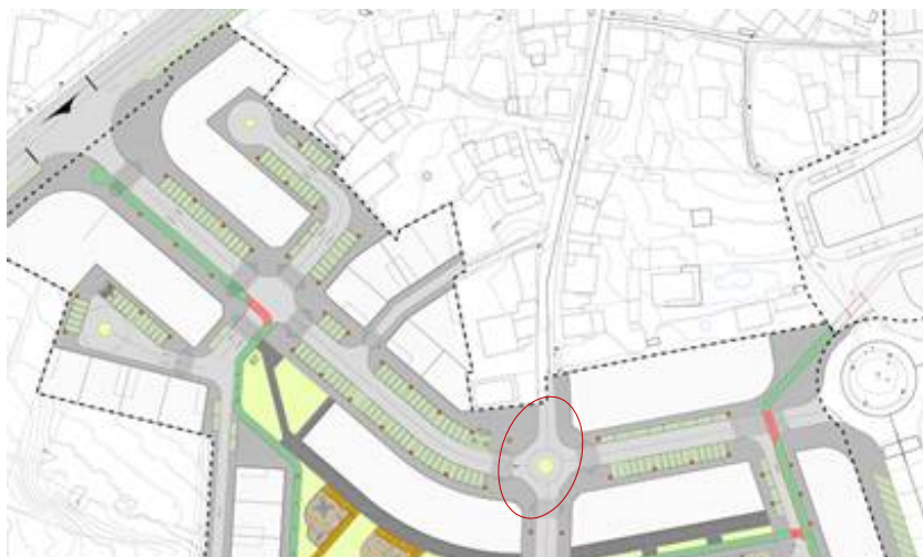
Figura 1. Rotonda susceptible de comprobación detallada para a verificación da maniobrabilidade de transportes colectivos.

Dentro do Anexo 06: Trazado refírese que o transporte colectivo local ten rutas establecidas que circulan de xeito preferente polos viais principais do ámbito. Sen contradicir esta información, cómpre matizar que a zona é frecuentada por transportes colectivos distintos os das liñas de autobús con paradas prefixadas o que aconsella validar que os viais de conexión coa rede principal permiten a circulación deste tipo de vehículos. Neste senso considérase que durante a execución dos traballos se debe verificar a capacidade destes vehículos para facer certas manobras, poñendo especial atención, pola súa relevancia dentro da mobilidade no ámbito, ó deseño da rotonda situada no vial de prolongación da Rúa Lamelas e que conecta coa Avenida de Europa.