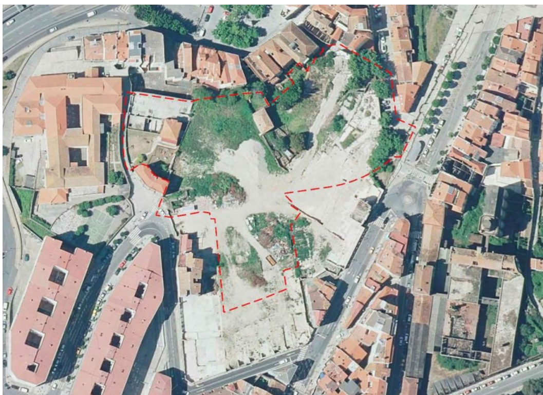
Delimitación do polígono único da área de repartición AR 1-01 sobre ortofotografía

extensión da cidade cara ó suroeste resultantes da forte expansión vivida nos anos sesenta e setenta do pasado século. Un borde de transición entre o tecido da Zona Vella e os novos crecements da cidade cara a rúa de Torrecedeira que constitúe unha unidade morfolóxica diferenciada e que hoxe en día caracterízase como un baleiro urbano na trama da cidade central en acelerado proceso de degradación