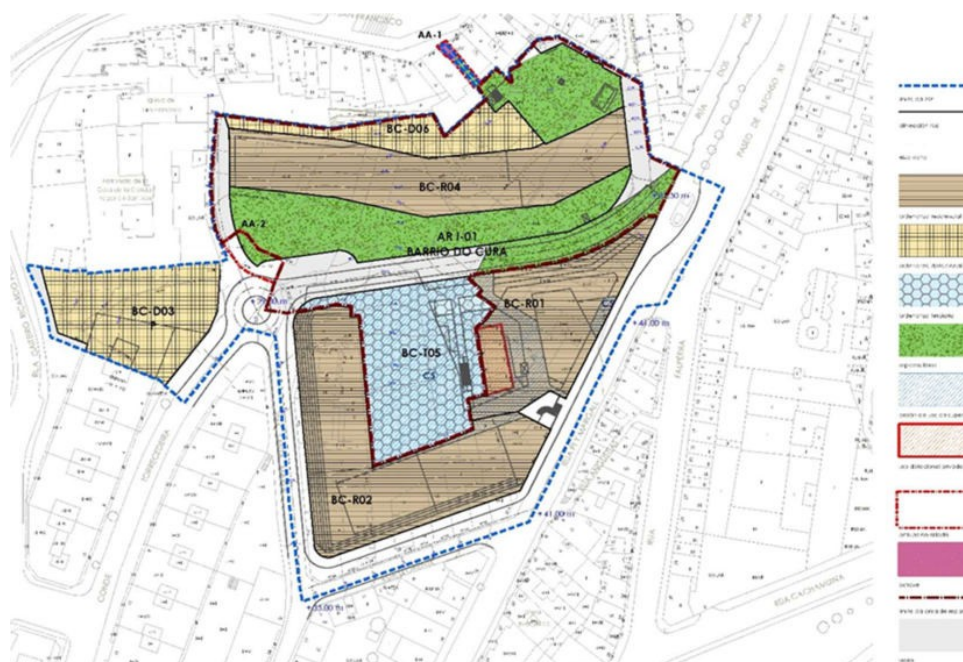
Imaxe 1. Delimitación da Área de Repartición en solo urbano non consolidado AR-1 (en liña descontinua de trazo e punto granate) sobre a ordenación detallada do ámbito da MP-BARRIO DO CURA.

Esta ordenación foi establecida directamente pola Modificación Puntual do PXOU de Vigo de 1993 para a reordenación do Barrio do Cura, en desenvolvemento das determinacións estruturantes establecidas para este ámbito de solo urbano non consolidado na correspondente ficha de planeamento