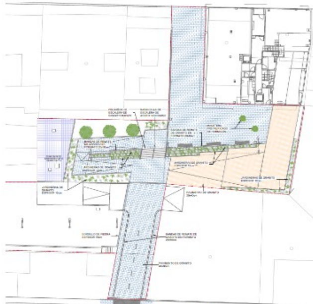
Ordenación do API

115 e 117 e revitalizar os espazos residuais actuais nun recorrido peonil atractivo e urbanizado cos estándares actuais, o que tan só pode facerse dende unha proposta conxunta.