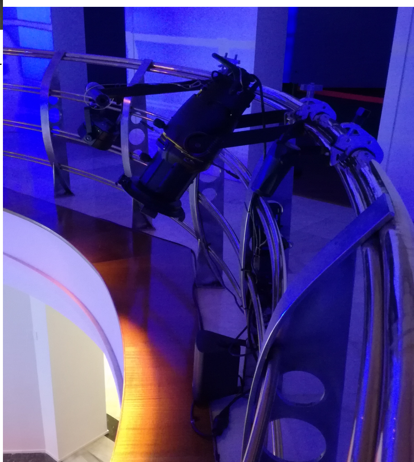
Ilustración 3: DETALLE ANCORAXE ILUMINACION AMBIENTAL