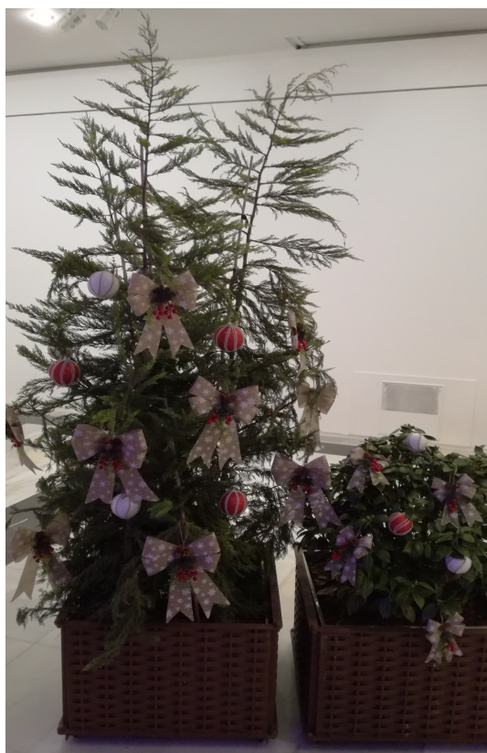
Ilustración 9: DETALLE ADORNOS SALA