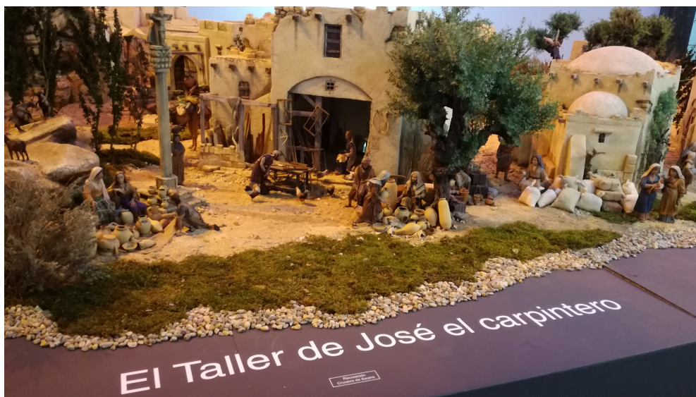
Ilustración 8: DETALLE ROTULACIÓN ESCENAS