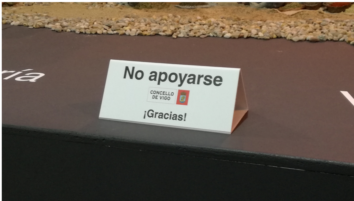
Ilustración 5: CARTEL INDICADOR TIPO