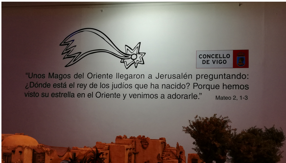
Ilustración 4: VINILOS TIPO PAREDE