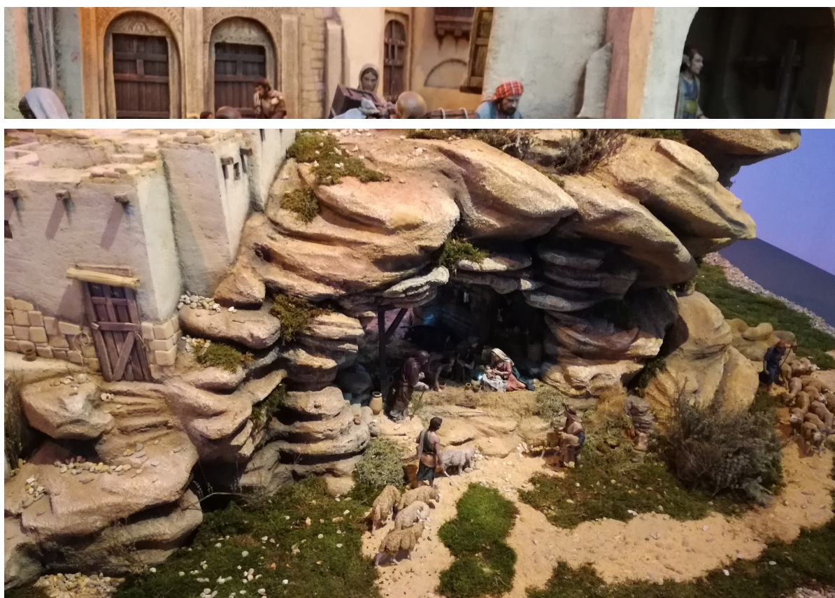
Ilustración 7: DETALLES ELEMENTOS NATUREZA