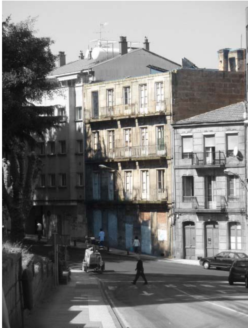
Rua Falperra: nº 30

FOTOGRAFÍAS DO ESTADO ACTUAL DA EDIFICACIÓN