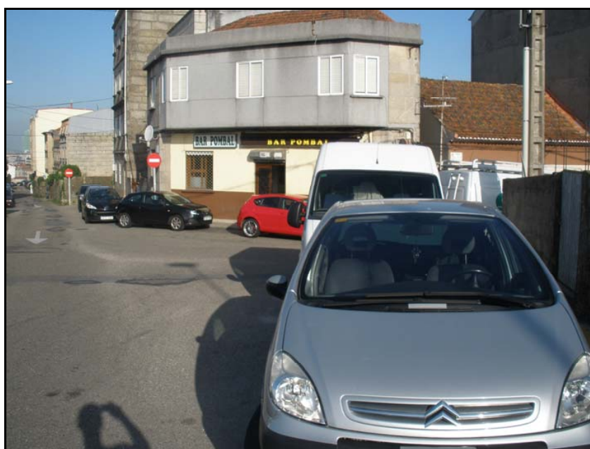
Fotografía nº 2