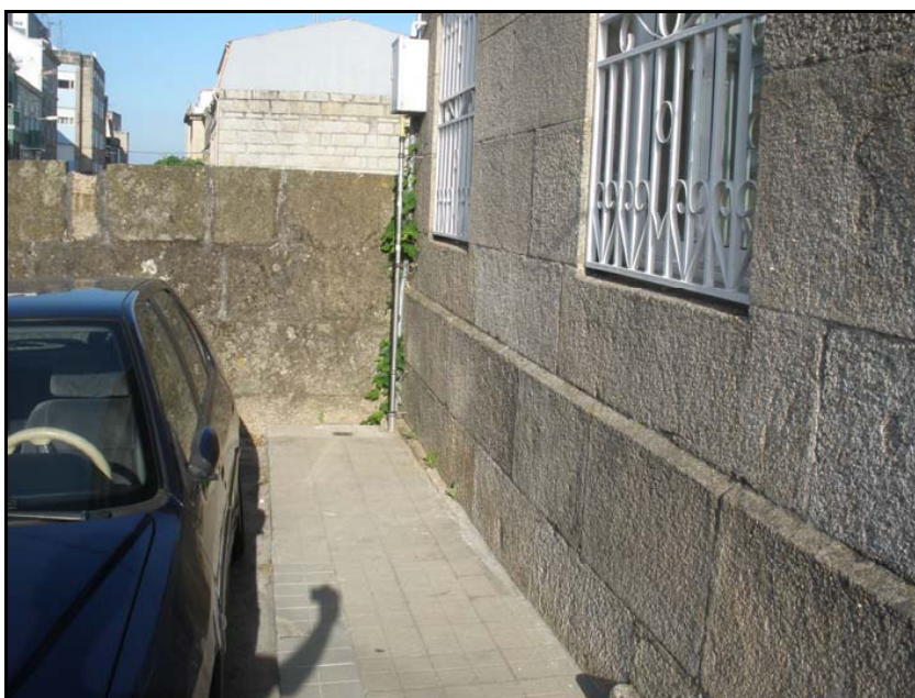
Fotografía nº 6