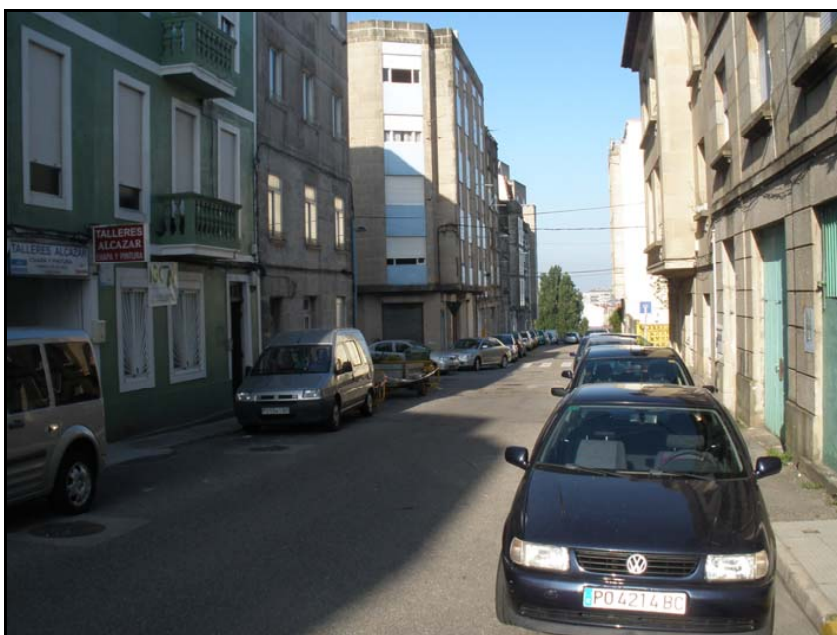
Fotografía nº 10