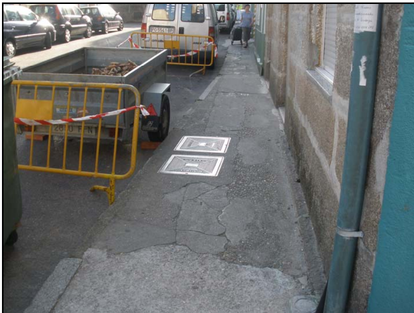
Fotografía nº 13