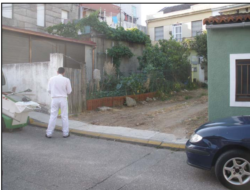
Fotografía nº 12