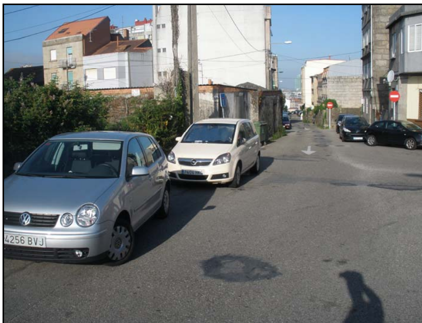
Fotografía nº 1