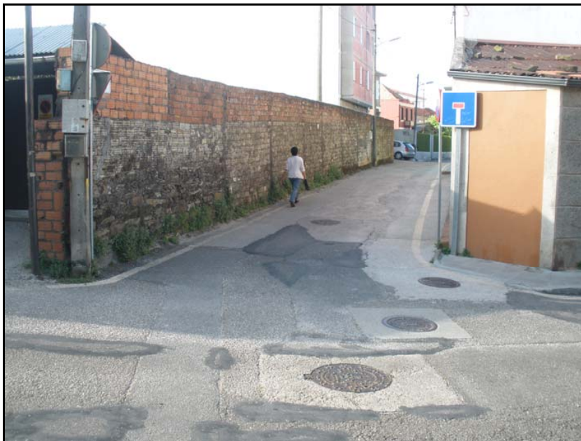
Fotografía nº 5