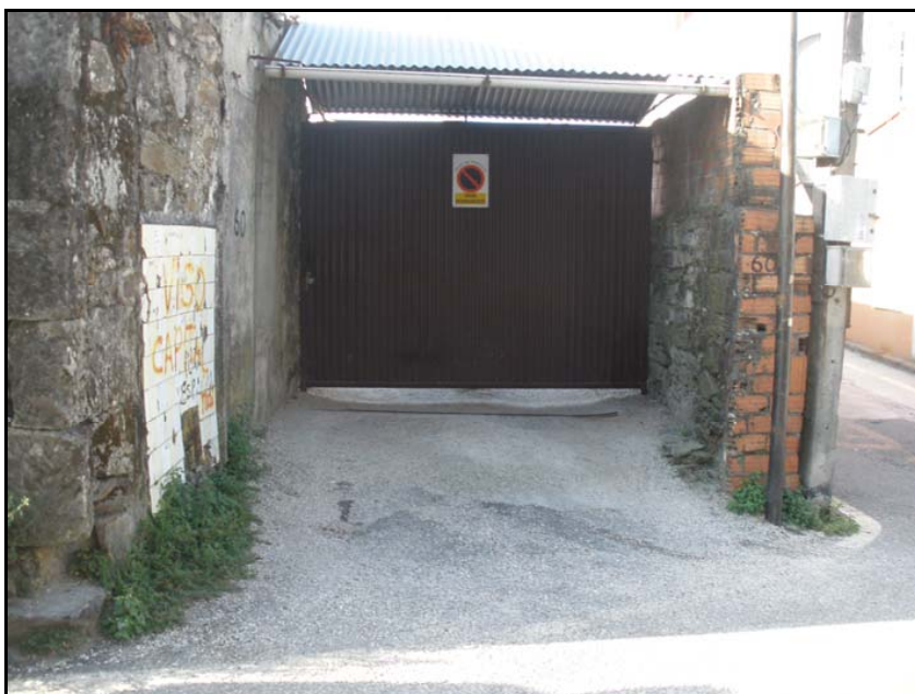
Fotografía nº 4