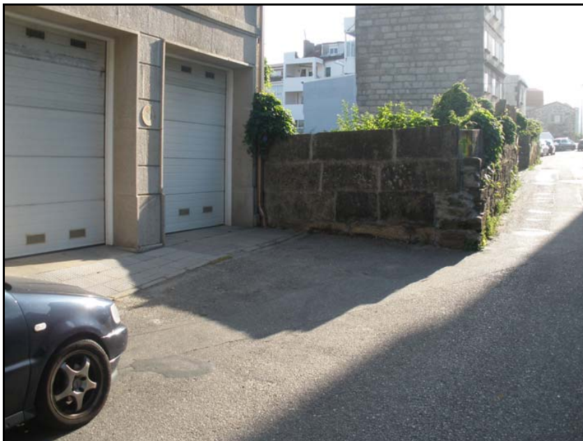
Fotografía nº 11