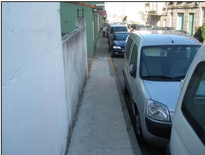
Fotografía nº 9