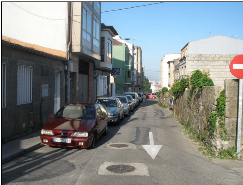
Fotografía nº 7