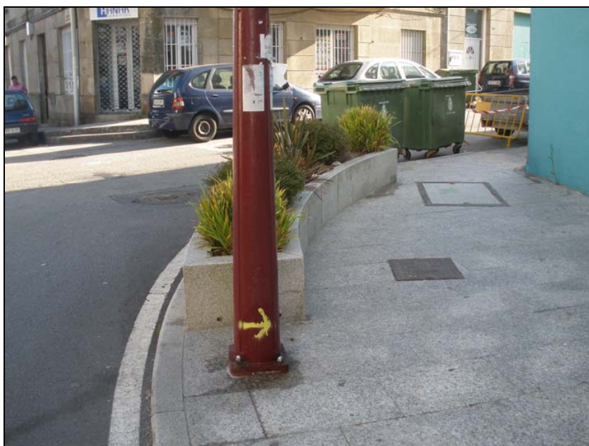
Fotografía nº 14