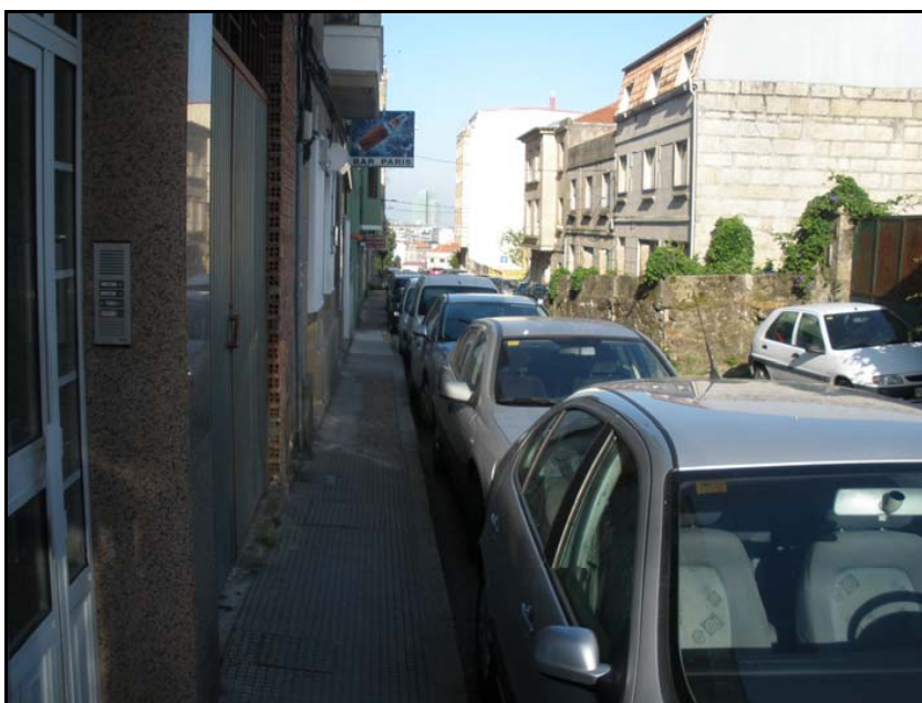
Fotografía nº 8