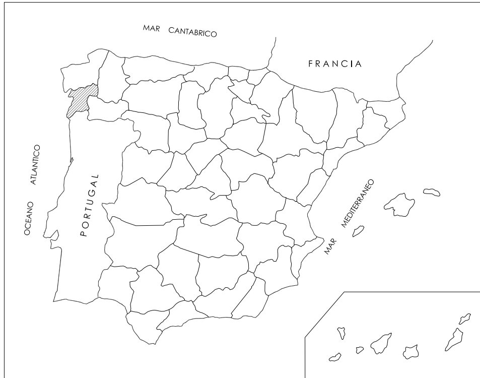
PLANO DE LOCALIZACION Sin escala